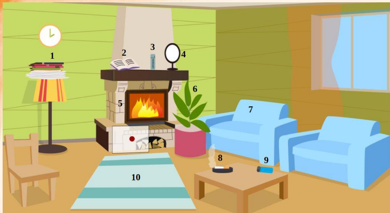
Рис. 4 Проверь найденные нарушения пожарной безопасности в гостиной