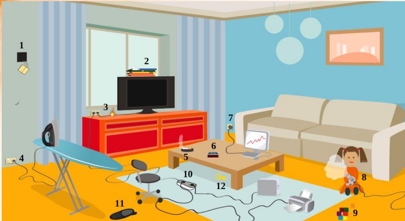
Рис. 3 Проверь найденные нарушения пожарной безопасности в гостиной