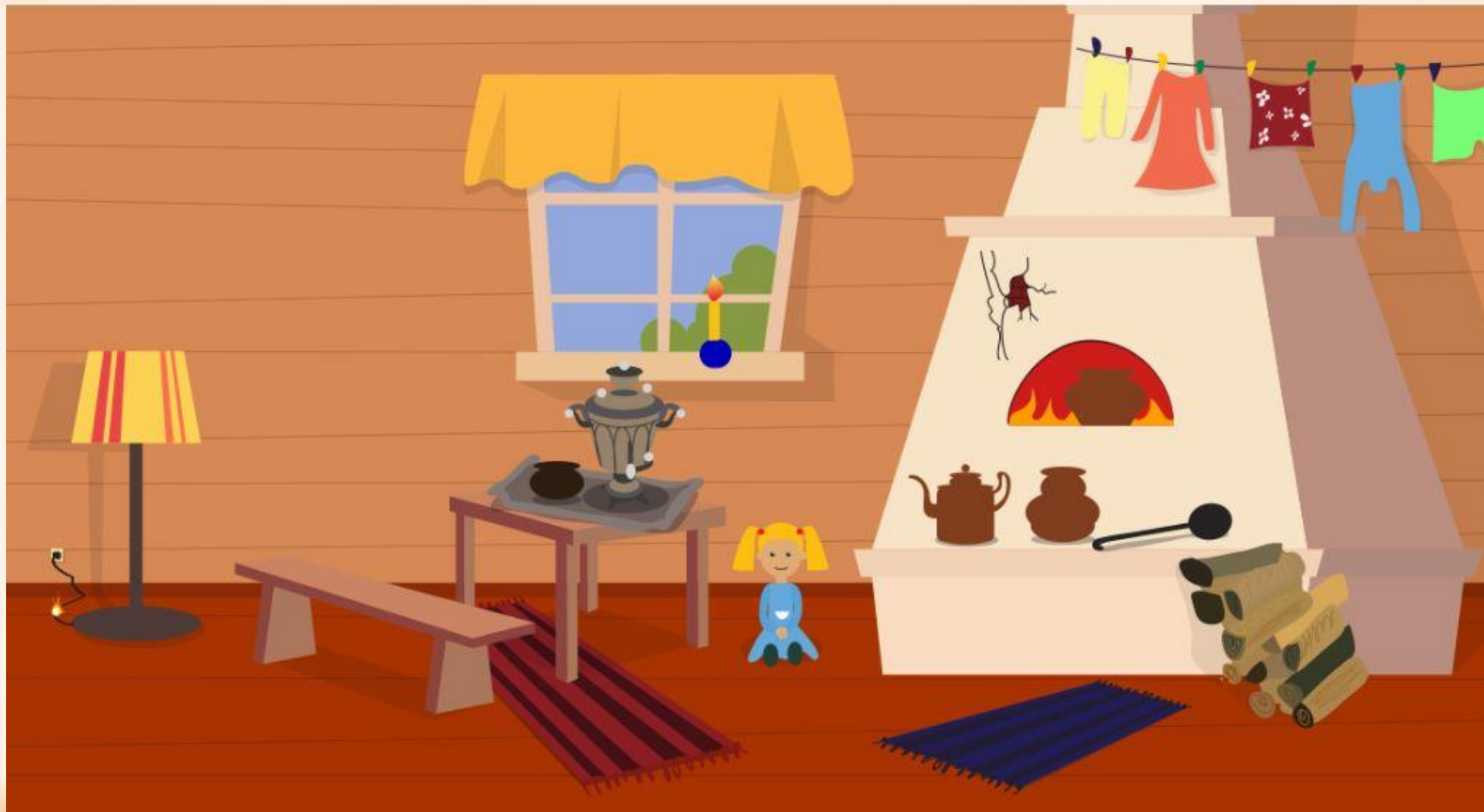
Рис. 1 Найди нарушения пожарной безопасности в доме (8 нарушений)