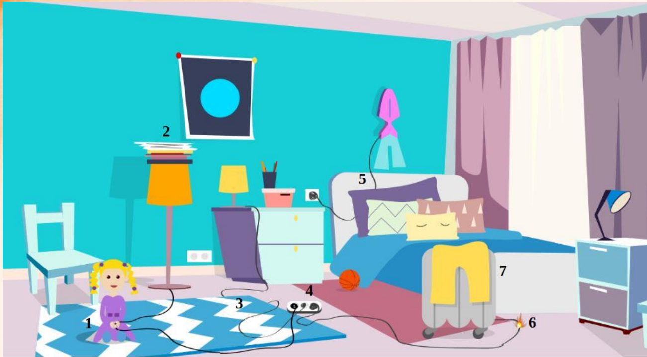
Рис. 5 Проверь найденные нарушения пожарной безопасности в детской