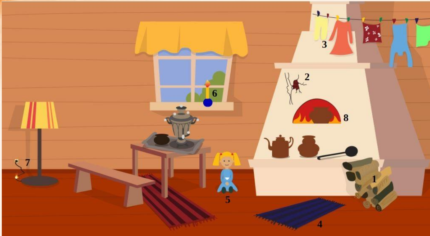
Рис. 1 Проверь найденные нарушения пожарной безопасности в доме