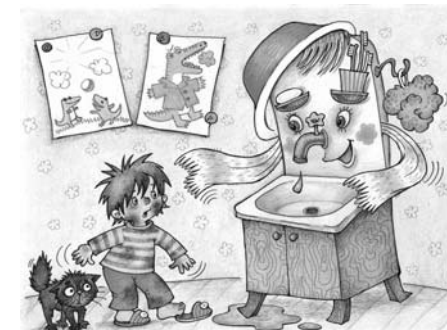
Пример демонстрационного материала из комплекта карточек «Что такое хорошо и что такое плохо».

III. Организационный раздел раскрывает: 1) основные подходы к организации образовательной деятельности в дошкольной образовательной организации; 2) рекомендации по адаптации парциальной программы «Мир Без Опасности» к запросу особого ребенка; 3) особенности взаимодействия педагогического коллектива с семьями воспитанников; 4) примерный перечень материалов и оборудования для создания развивающей предметно-пространственной среды; 5) список учебно-методических и наглядно-дидактических пособий, рекомендуемых для успешной реализации парциальной образовательной программы «Мир Без Опасности».