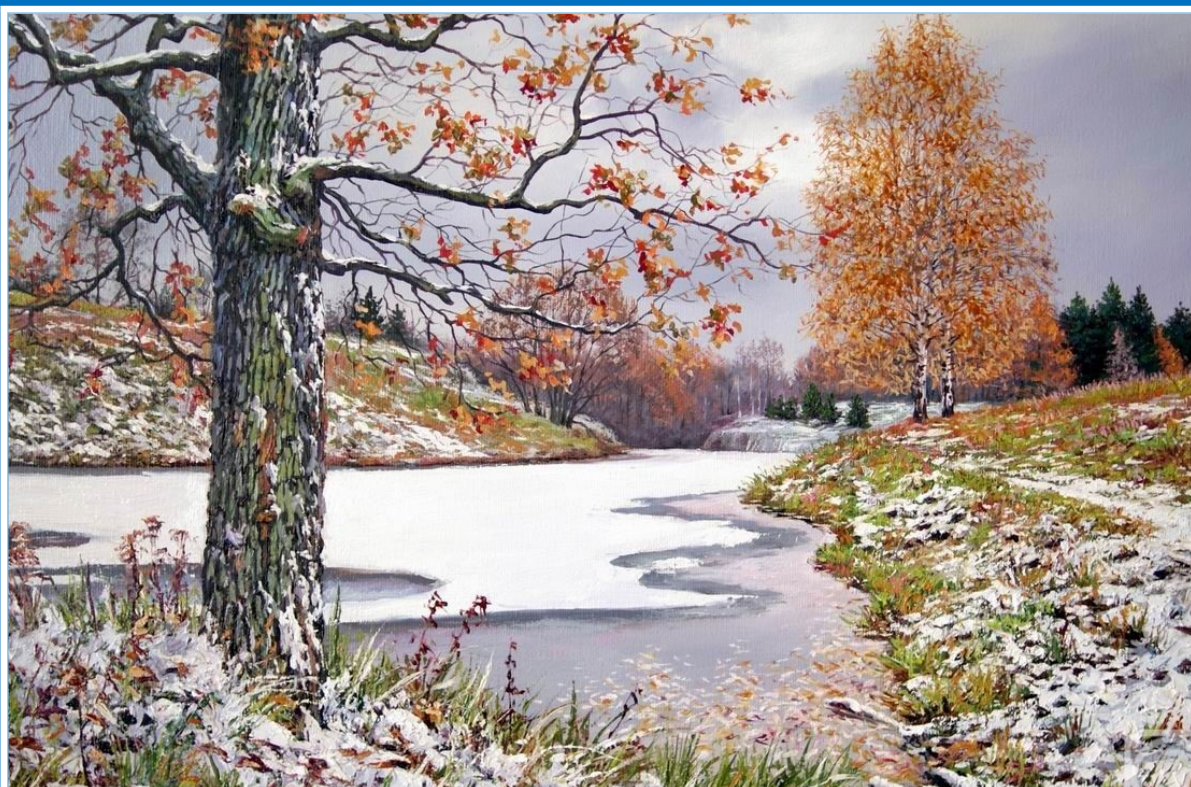
Вавейкин В. «Первый снег»

Муниципальное бюджетное дошкольное образовательное учреждение «Криулинский детский сад №3»