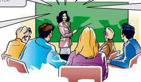
Права родителей (законных представителей)

знакомиться с уставом организации, осуществляющей образовательную деятельность, лицензией на осуществление образовательной деятельности, со свидетельством о государственной аккредитации, с учебно-программными и другими документами, регламентирующими организацию и осуществление образовательной деятельности